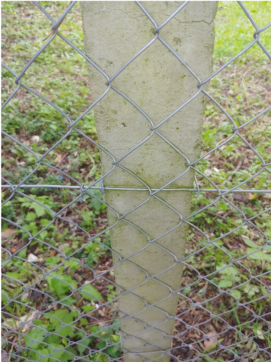
amarração do alamedado no mourão.