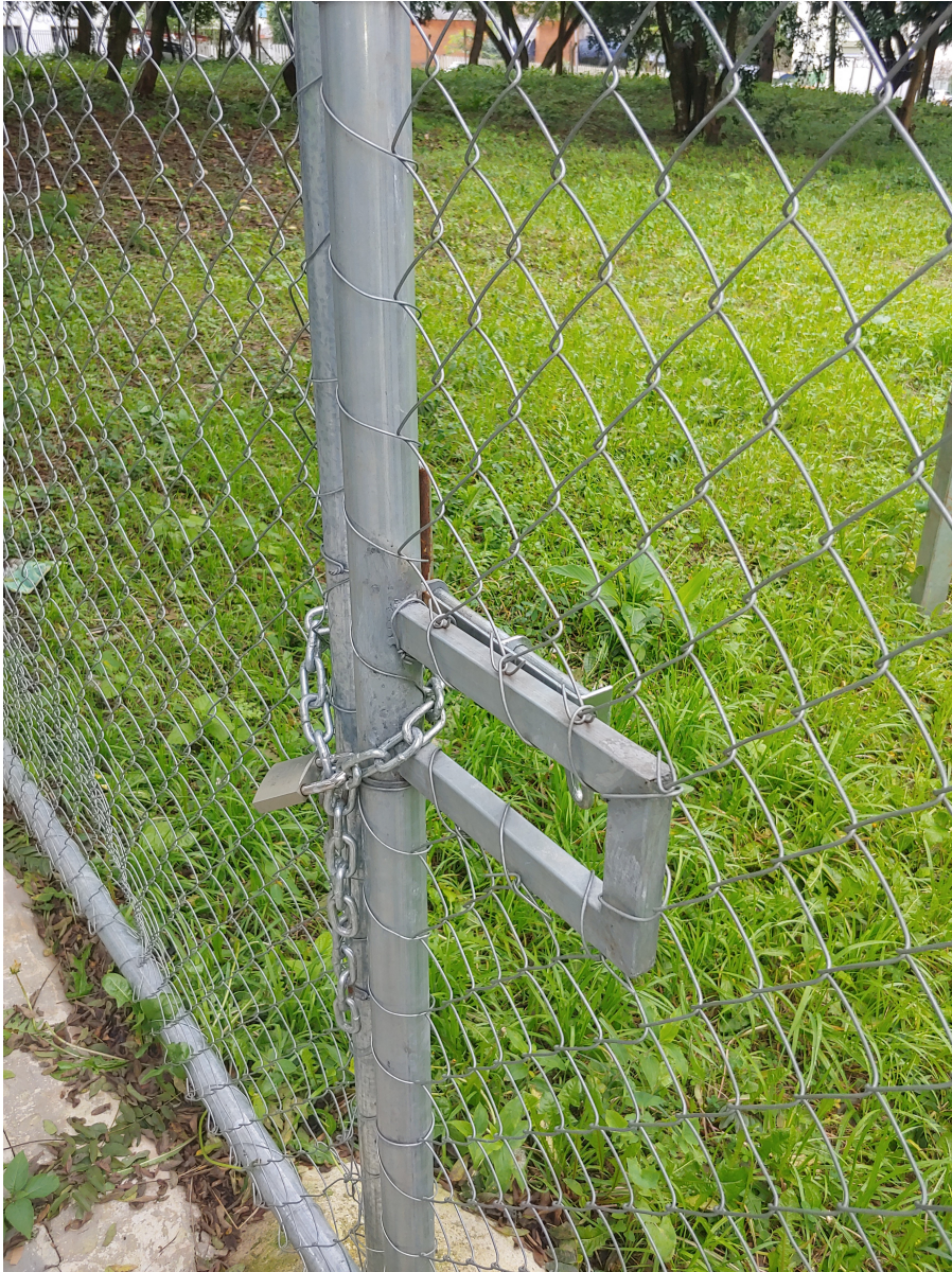
portão de acesso